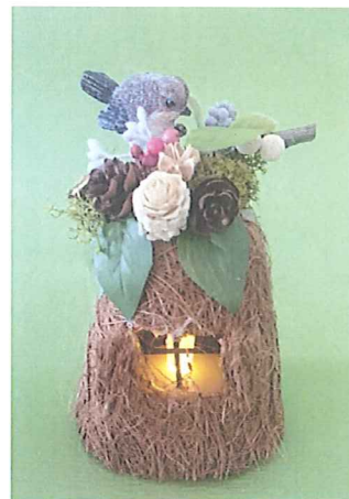
「森のルームライト作り(※イメージ)」