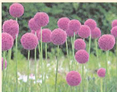
⑤ 球根類：ギガンチューム