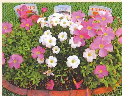
⑥ 草花苗：オキザリス