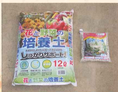
⑧ 培養土類： 培養土と草花の肥料セット