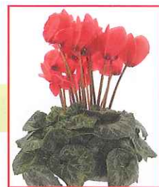
(シクラメンのイメージ)