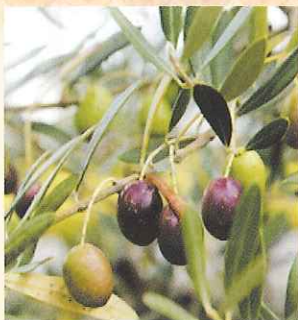
① 庭園樹木： オリーブ