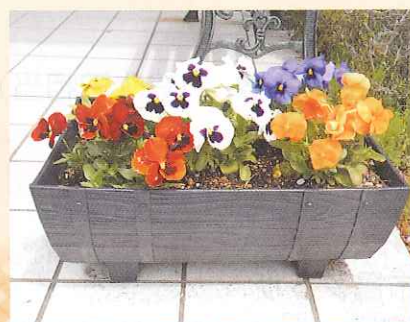
⑨ 法人フラワーポット： (7月：ペコニア11月：ハボタン3月：パンジー)