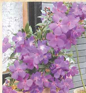
③ 鉢物花木： ノボタン